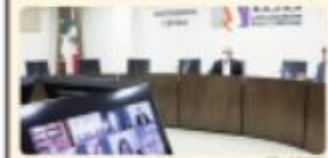
MEXICALI.- Los miembros del IEEBC a diputados a dar respuesta al taller más 100 días para elección.