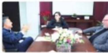
TIJUANA.- Reunión política pública entre municipal y federal.